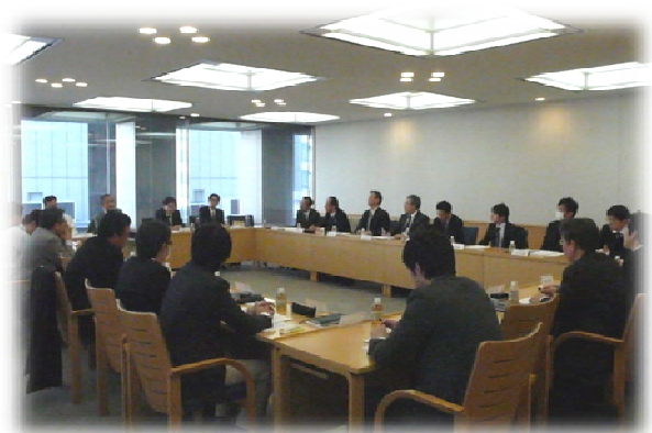
協議会総会開催の様子